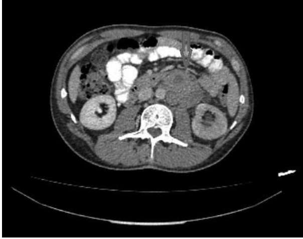
Resim 1. NSGHT tanılı hastanın paraaortik alandaki lenfadenopatileri (ok).